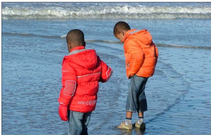
Naar het strand

Op een fraaie zaterdag in januari besloten we naar het strand van Hoek van Holland te gaan. Tot dan toe waren we wel een paar keer naar de Loonse en Drunense Duinen geweest maar de zee hadden onze jongens nog nooit gezien. Ze waren toen 10 maanden bij ons. We gingen nog niet zo veel met hen weg. De afgelopen maanden hadden al voor voldoende spanningen gezorgd; een paar verjaardagen, Sinterklaas, Kerstmis, Oud en Nieuw.